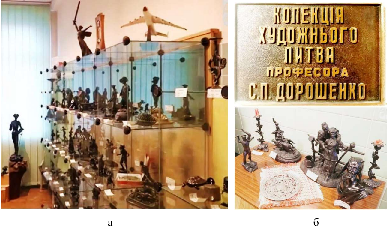
Рисунок 5. Експозиційний простір музею художнього литва: а – фрагмент інтер'єру з тематичними розділами колекції; б – меморіальна лита табличка та взірці декоративного чавунного литва, які ілюструють багатство фактур

Поряд із монументальними проєктами, майстри та зацікавлені студенти кафедри активно опановували створення камерного кабінетного литва. Знаковою подією в житті підрозділу стало створення професором С. П. Дорошенком музею литва, де представлено його унікальну колекцію художньо-декоративних виливків (рис. 5).