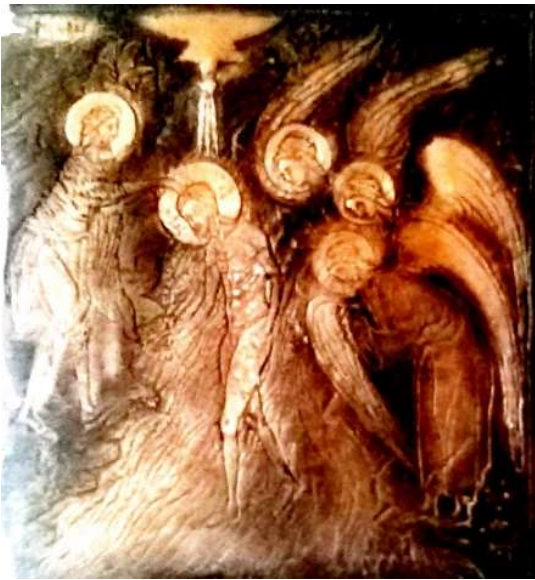
Рисунок 2. Сюжетна композиція «Хрещення Господа нашого Ісуса Христа» (1997 р.): бронзове литво розміром 36×35 см [4]; відтворення виконано формувальником Д. В. Белановським та карбувальником А. С. Кочешковим