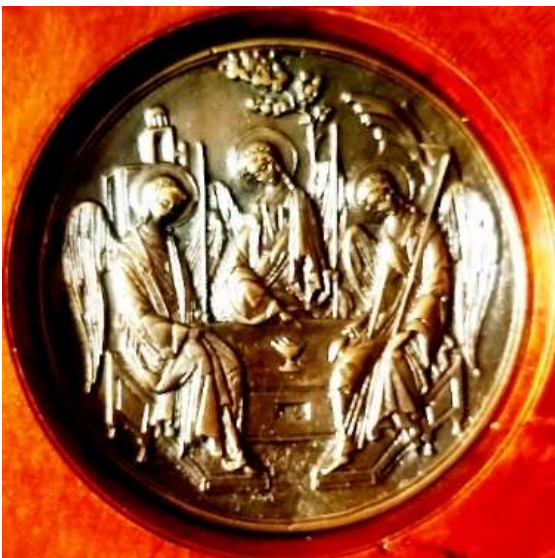
Рисунок 8. Барельєфна композиція «Трійця»: художнє бронзове литво, що демонструє майстерність передачі об'єму та деталізації в металі