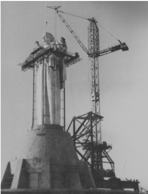
Рис. 2. Монтаж фігури

В історичних документах повідомляється, що метал для пам'ятника виробили в Запоріжжі. Це сталь – на Дніпроспецсталі виробляли нержавіючі злитки, а в прокатних цехах Запоріжсталі їх перекочували в листи. В Києві сталеві компоненти збирали в одну конструкцію, в основі закладено сталевий каркас, який є основним і забезпечує міцність і стійкість скульптури. Зовні видно пластинчастий каркас і облицювання. А між ними є ще один невидимий шар бандаж – каркас, який є з'єднувальною ланкою між основою і пластинами. Для монтажу (рис. 2) пам'ятника змонтували спеціальні надвисокі крани) [2].