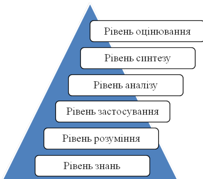
Рис. 1. Класифікаційні рівні засвоєння інформації студентами за таксономією Блума

Таксономія освітніх завдань у когнітивній сфері Б. Блума, яка створена у співавторстві в 1956 році, сьогодні називається традиційною та вважається актуальною. Вченими для оцінювання рівня засвоєння інформації та визначення навчальних цілей виділено такі шість рівнів: знання, розуміння, застосування, аналіз, синтез, оцінювання (рис. 1). Базовим є рівень знань, і просування студента в навчальному процесі за кожним наступним рівнем цієї піраміди виводить його на наступний щабель – вищий ступінь засвоєння матеріалу.