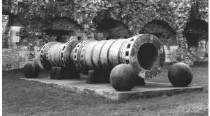
Фото 1. Базиліка, https://www.wiki.uk-ua.nina.az/html

Базиліка, або Оттоманська гармата (фото 1). В історичних документах повідомляється, що Базиліка, або Оттоманська гармата – величезна бомбарда, відлита з бронзи.