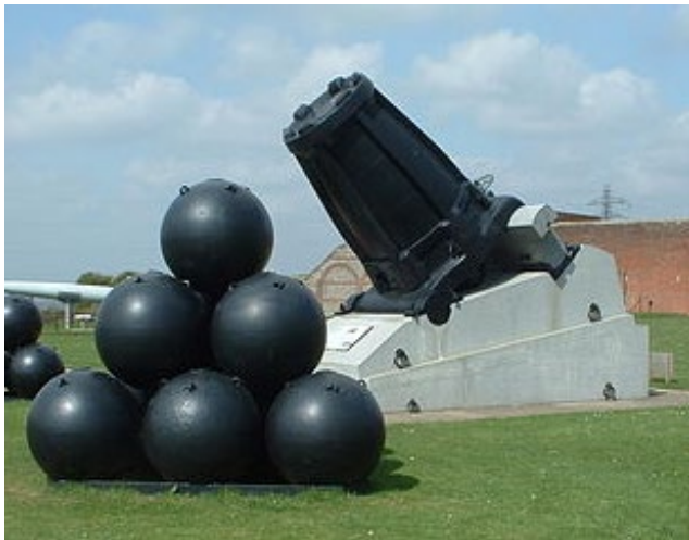
Фото 3. Мортира Маллета

В результаті було побудовано артилерійську зброю Little David, яка побила всі рекорди за розміром калібру. Вона мала вагу 82,808 т, калібром 914 мм з нарізним стволом завдовжки 712 см і систему вертикального прицілювання. Ствол гармати зроблений зі сталі, легованої марганцем і молібденом. Недоліком було те, що вона мала недостатній радіус ураження і не могла похвалитися влучністю стрільби. До