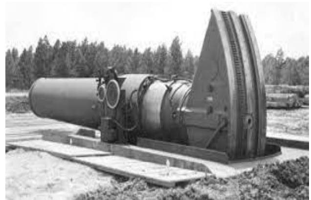
Фото 5. Невстановлена гармата і снаряд до неї,