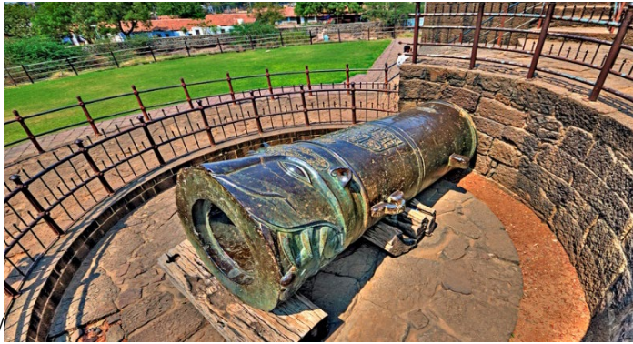
Фото 2. Малік-і-Майдан, https://en.wikipedia.org/wiki/Malik-E-Maidan

Вона була відлита в Ахмаднагарі у 1548 році, за правління Бурхана Нізана Шаха під керівництвом начальника артилерії Мухаммада бін Хассана Румі (Muhammad bin Hassan Roumi). У цьому йому допомагав Румі-хан, хто, власне, і відлив гармату.